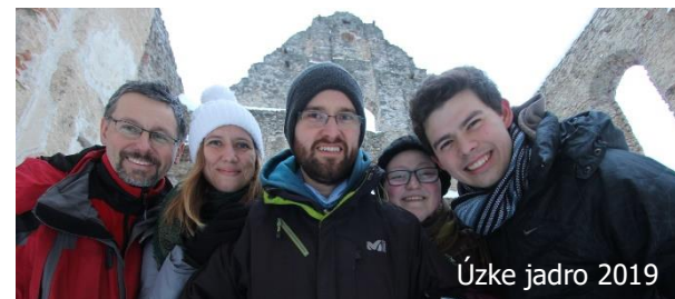
Úzke jadro 2019