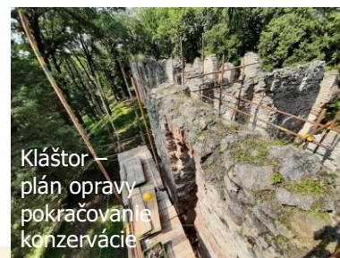
Kláštor – plán opravy pokračovanie konzervácie