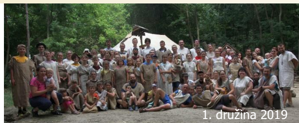
1. družina 2019

V rámci celého roka fungujeme v tímoch, spoločenstvách a organizujeme rôzne podujatia pre našich dobrovoľníkov, ktorí už absolvovali dvojtzádnovú družinu. Okrem 1. družiny pre skúsených a rodiny (s OP Monachusom , vpravo) aj 6. družinu („búračku“, OP Urbion ), ktorá bola skvelým završením sezóny, kde sa stretli mladí aj ostrieľaní Katarínkovci a spolu dokončili letné práce na zaklení krypty a zbalení tábora. Stretno eSko funguje už od r. 2009 a v roku 2019 sa v rámci neho stretávalo a formovalo pravidelne 30 mladých ; ďakujeme pastierom a lídrom eSka aj trnavského a brnianskeho stretna za ich služby.