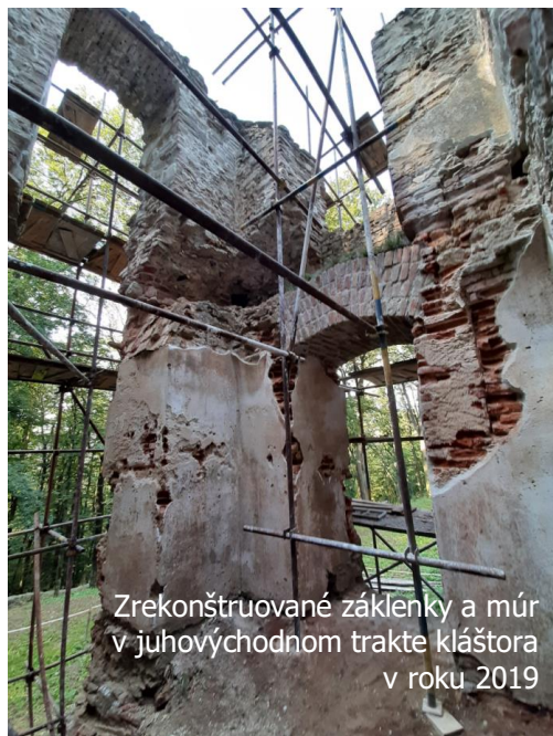
Zrekonštruované záklenky a múr v juhovýchodnom trakte kláštora v roku 2019