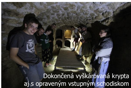
Dokončená vyškárovaná krypta aj s opraveným vstupným schodiskom

Na Katarínke na okraji tábora pribudol aj takýto skladovací kontajner – museli sme riešiť uskladnenie náradia, lešenia a ďalších súčastí tábora bez toho, aby sme všetko každoročne práce vyvážali z Dechtíc a späť.