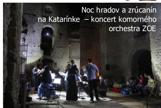
Noc hradov a zrúcanín na Katarínke – koncert komorného orchestra ZOE

Tento rok sme pokračovali v sprevádzaní návštevníkov Katarínky počas celej pracovnej sezóny a turizmačka služba je už samozrejmom súčasťou našich aktivít. Tiež sme zorganizovali 19. ročník Bielonedel'nej púte na Katarínku pre vyše 200 pútnikov, Noc kostolov v júni. Zorganizovali sme už tradičný Deň otvorených dverí (DOD) -