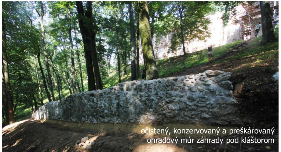
očistený, konzervovaný a preškárovaný ohradový múr záhrady pod kláštorom