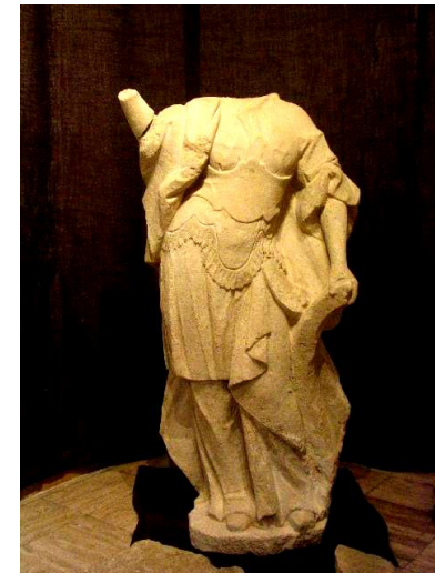
Oltárna socha sv. Kataríny zo začiatku 18. storočia nájdená v r. 2004 pri archeologickom výskume presbytéria

1995 – 3. júl – malebné rúcaniny opäť ožívajú vďaka mladým dobrovoľníkom a ich novému „rádu Katarínkov“ - záchrancov kláštora